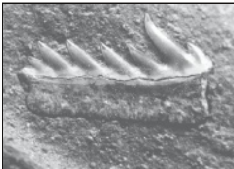
Území obce Bystřice nad Olší je známé mj. množstvím pravěkých nálezů, které zdejší kronikář pečlivě eviduje. Na snímku zub terciérního žraloka Heptranchias sp. uložený v Moravském zemském muzeu.

Vedení Obecního úřadu v Bystřici si je vědomo důležitost práce kronikáře, a snaží se mi vytvořit optimální podmínky pro mou práci. Nejde jen o materiální vybavení (PC, diktafon, tiskárna, apod.), ale v posledních dvou letech mám k dispozici svou kancelář v budově OÚ a v této místnosti tak mohu mít deponitář a archiv. K přepisování textů mám vyčleněnou jednu pracovní sílu, která